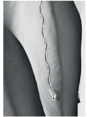
FIRST TRACK #2, ÖSTERREICH, 2008, PIGMENTDRUCK AUF BARYTPAPIER, 24 X 36 CM, EDITION 4/25