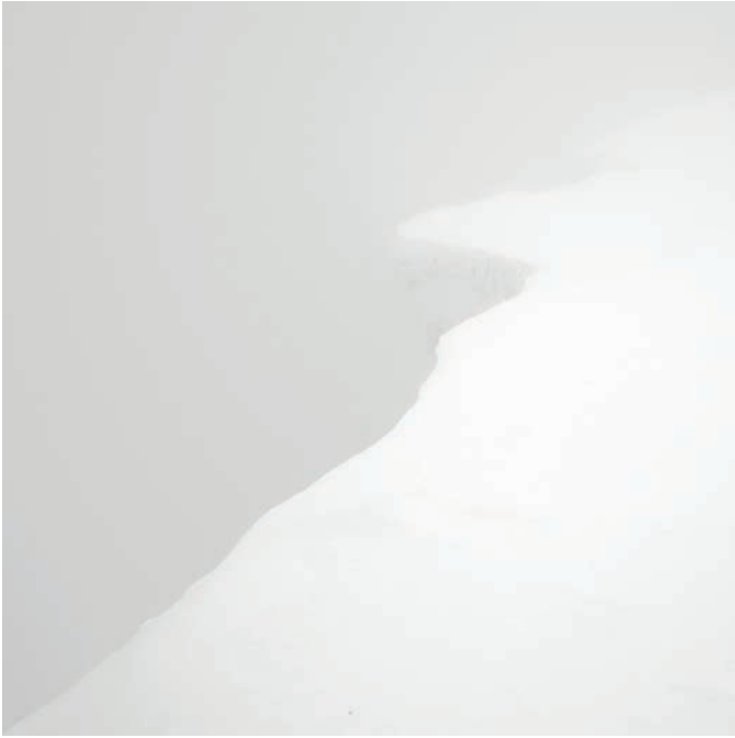
POINTE HELBRONNER, ITALIEN, 2014, PIGMENTDRUCK AUF BARYTPAPIER, 50 X 50 CM, EDITION 4/10