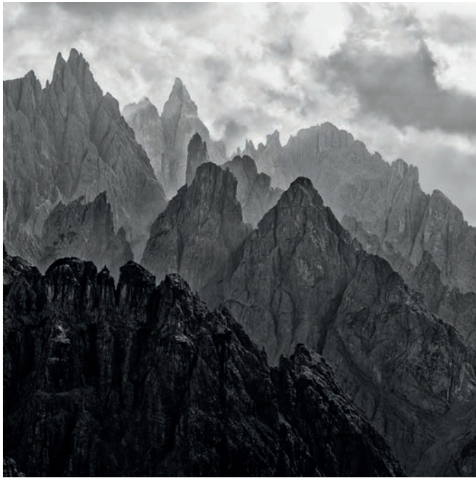
CADINI DI MISURINA, ITALIEN, 2011, PIGMENTDRUCK AUF BARYTPAPIER, 50 X 50 CM, EDITION 10/10