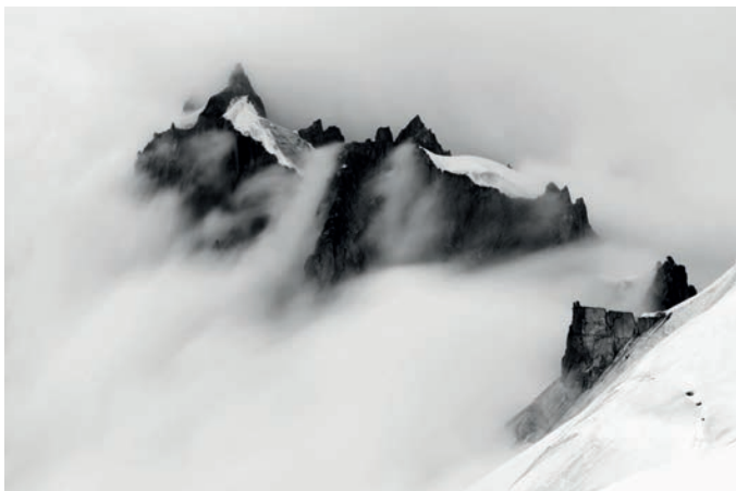
AIGUILLE PLAN 2, 2012