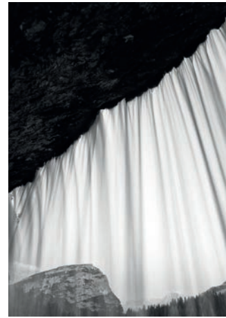
CASCATA DI FANES, ITALIEN, 2011, PIGMENTDRUCK AUF BARYTPAPIER, 135 X 100 CM, EDITION 3/5