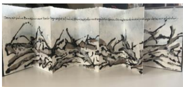
Josef Walch Künstlerbuch "Die Bäume" zu einem Text von Franz Kafka, 2018