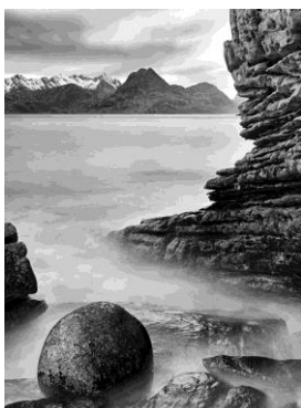
Peter Mathis, Elgol, Schottland, 2018