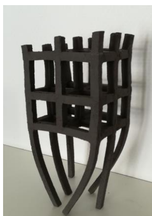
Tom Feritsch Spitzentanz schwarz, 2017

„Kunst tut gut“. Eine Auktion zugunsten des Kompetenzzentrums zu sexuell übertragbaren Infektionen. Mannheim (KOSI.MA).